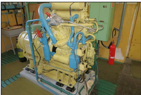
Rys. 3. Sprężarka powietrza nurkowego EK 7,5-3 produkcji ZSRR.