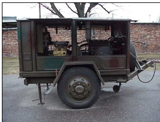
Rys. 4. Zestaw zasilania bazy zabezpieczenia prac podwodnych "ORTOLAN" wraz ze sprężarkami powietrza nurkowego EK 2-150 produkcji ZSRR.

Niewystarczająca konfiguracja systemu uzdatniania powietrza oddechowego oraz stosowanie filtrów oczyszczających wypełnionych np. tylko jednym z rodzajów substancji absorbujących 4 i adsorbujących 5 (np. węgiel aktywny lub wapno sodowane) nie mogło zapewnić oczekiwanej jakości.