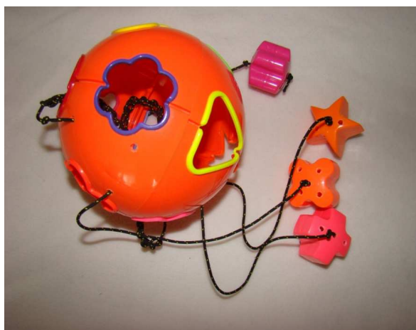
Fig. 2. Object used in the experiment to evaluate the rescuers' underwater performance.

The participants were asked to perform two rescue operations. An independent variable was introduced in the experimental operation – a completion of an additional task under water. A yellow buoy was placed at 60 metres, in the phase where the rescuer was to reach the drowning person. The task was to perform a dive at the buoy and carry out a simple logical operation at the depth of approx. 150 cm - to match and position four different elements in the holes of a submerged object. The object was a geometric figure with 12 holes hung on a rope and fixed to the buoy at the depth of 150 cm. The elements were attached to the submerged figure with thin cords securing them from being lost or dropped to the bottom (Fig.2). The second procedure, a control operation, was carried out in a standard manner, without the requirement to perform an underwater task. The presented experiment consisted in making a comparison between the effectiveness of a standard rescue operation with an operation enhanced with a certain impediment.